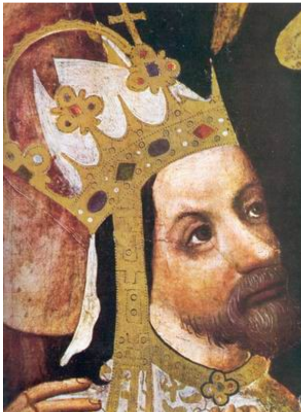
Imperatore Carlo IV di Lussemburgo