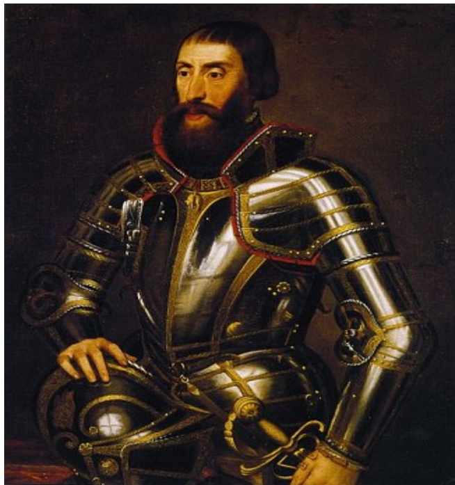
Ferdinando I d'Asburgo

Anche l'imperatore Massimiliano I (1459-1519) impose ai sudditi il divieto di disturbare fagiani e caprioli nei boschi mediante il pascolo dei bovini. La diffusione dei fagiani nelle zone libere è stata favorita dall'introduzione dell'allevamento semi-selvatico. Verso la fine del '500 si contavano 74 allevamenti di fagiani di cui 68 in Boemia e 6 in Moravia. In quel periodo la perizia raggiunta nelle terre boeme nell'allevamento dei fagiani era conosciuta in tutta l'Europa. Il Phasianus colchicus assunse una notevole importanza commerciale tanto che nei paesi confinanti si iniziò a chiamarlo impropriamente il fagiano boemo.