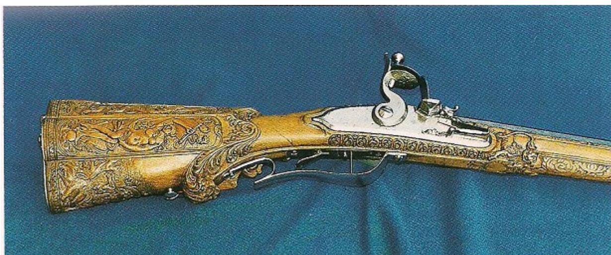
Particolare Fucile del 1650. Museo della Caccia del Castello di caccia di Ohrada

E' noto che già nel 1630 si usavano schioppi per la caccia ai fagiani.