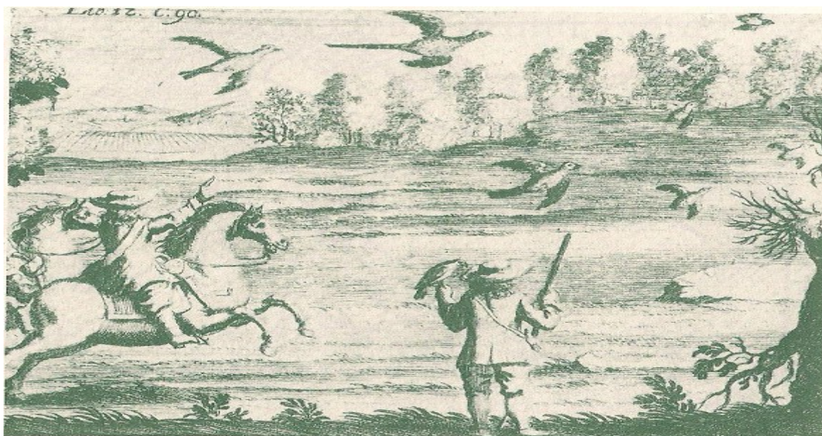
Caccia al Fagiano con il Falco. Georgica Curiosa 1682

Risulta anche in modo chiaro il ricorso alla falconeria nella caccia al fagiano.