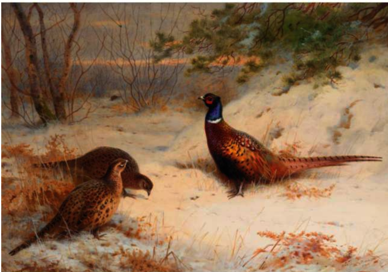
Archibald Thornburn - Fagiani nella neve