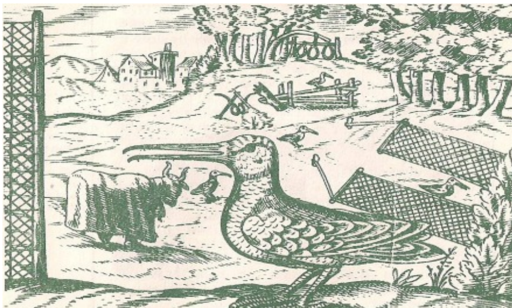
Trappole per la caccia alla beccaccia

L'elenco degli strumenti usati per l'aucupio é documenta da Klaret già nel XIV secolo nei suoi dizionari mentre tre secoli più tardi una descrizione dettagliata dell'uccellazione ci viene offerta da J. A. Komenský nella sua opera Orbis Pictus .