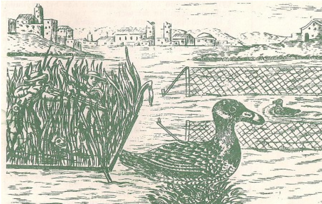
Caccia alle anatre selvatiche. Aitinger 1653

In passato le anatre venivano catturate con vari tipi di reti, analogamente alle pernici. Un tipo di rete utilizzata erano le reti dette diluvio a forma di imbuto che venivano sistemate tra le canne degli stagni.