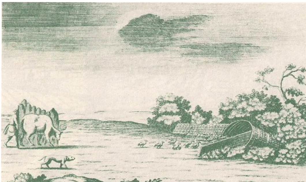
Rete a imbuto per caccia alle starne. Fleming 1724

Per la caccia alle beccacce si utilizzavano delle trappole simili a quelle per il gallo cedrone ma con dimensioni inferiori, in particolare era di minore la dimensione dei rombi costituiti dall'intreccio dei lacci. Con la diffusione dei fucili da caccia è aumentato l'aucupio primaverile alle beccacce in canto. Questo metodo tradizionale di caccia è prevalso fino agli anni 60 pur essendo molto nocivo per la nidificazione ed il mantenimento della popolazione di questo volatile. I colombacci venivano catturati con le reti che si chiudevano, detti copertoni . Per la cattura di starne e quaglie si ricorreva principalmente a diversi tipi di reti. La cosiddetta larga era una rete alta diversi metri, lunga anche qualche centinaio di metri in cui le starne venivano spinte dai battitori e prese al volo. Il diluvio era invece un tipo di rete a imbuto in cui le starne venivano catturate da terra.