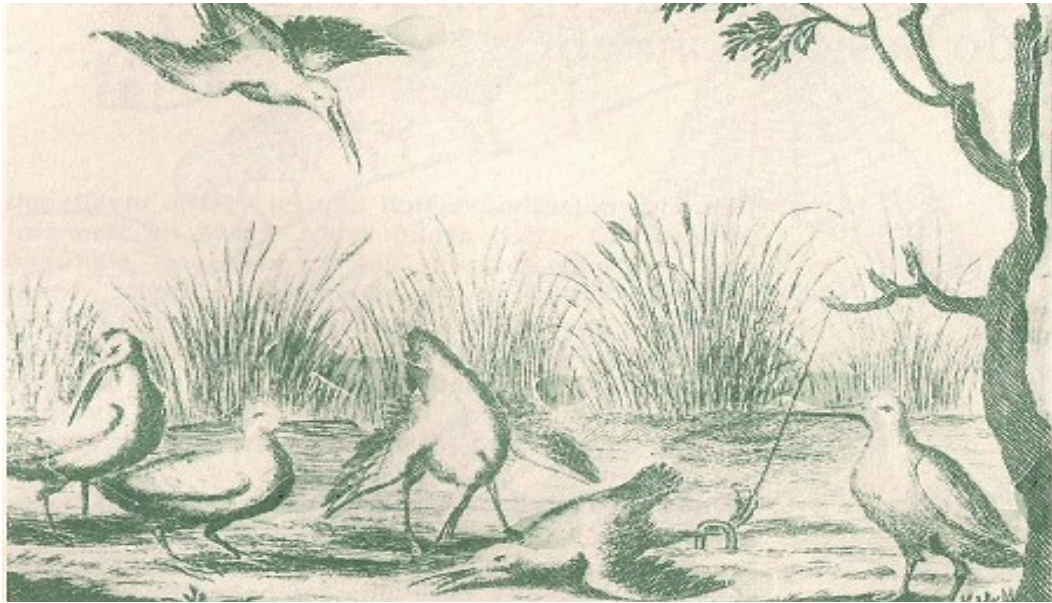
Trappola per uccelli. Georgica curiosa 1682