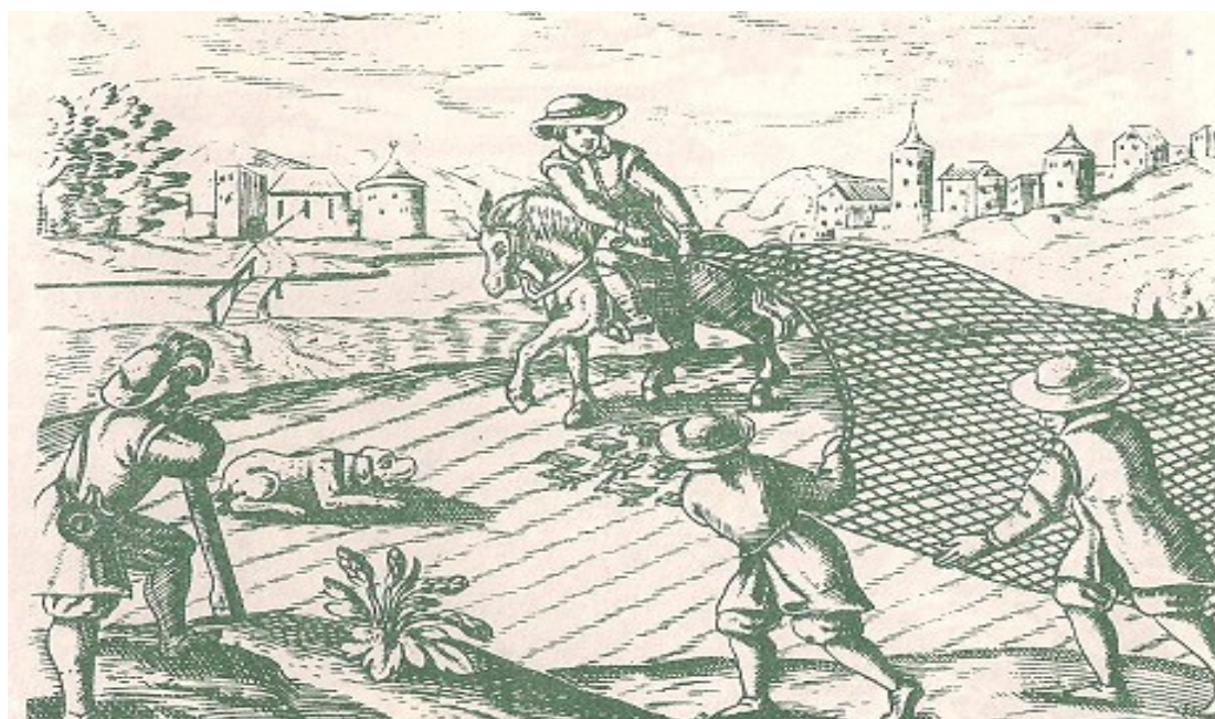
Caccia alle pernici con le reti. Aitinger 1653

Oltre alle reti gli uccellatori usavano altre tecniche come archetti, lacci, vergelle invischiate o gabbie.