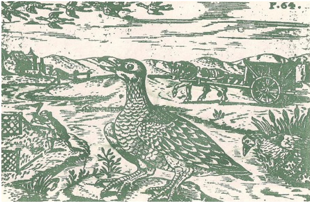
Cacciatore nascosto nel carro per la caccia all'oca selvatica

La cattura delle oche selvatiche era molto difficile in quanto si tratta di animali sospettosi cui è praticamente impossibile avvicinarsi. In passato le oche si catturavano nelle reti o , come avveniva per le otarde, i cacciatori le ingannavano col metodo di caccia alla posta nascondendosi nel carro.